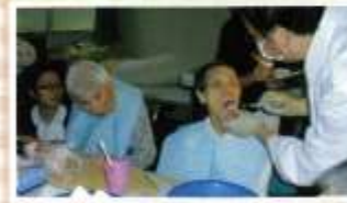
柳田新生寮 11月19・21日