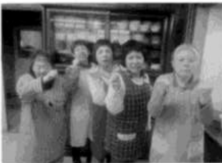
これからもお手伝い頑張ります！

平日の食事時間の前に当番の利用者が厨房の職員の手伝いを行っています。主にテーブルに鍋やおひつ、食事の配膳やおしぼり等を配っています。年々当番に入る事が出来る利用者が減っていますが、現在当番に入っている利用者は当番を行っている事で充実感を感じ、当番が終わった時には良い表情がみられます。厨房職員からは「いつも配膳を手伝ってくれて助かっている。利用者さんがいるといないでは大変さが違う」との話がありました。厨房当番が減り利用者個人の負担が大きくなってきていますが、職員と協力し出来る範囲で続けて欲しいと思います。