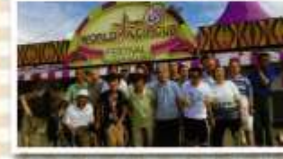
ポップサーカス観覧(竹生寮) 8月27日