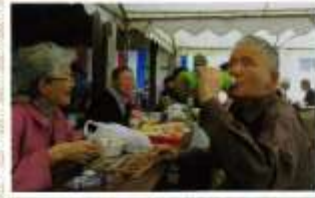
外での食事はおいしいなあ。