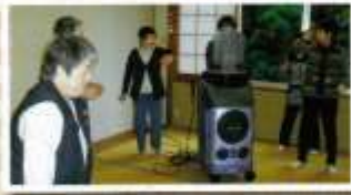
雄和サイクリングターミナル 11月7日