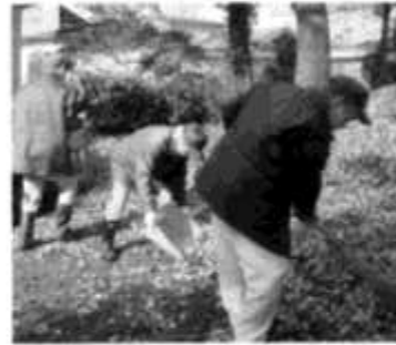
落ち葉が重くて大変！

11月14日、竹生寮の農産班、環境班、園芸班と柳田新生寮の男子実習班の利用者合同で町内清掃を行いました。両施設の職員と来寮していた実習