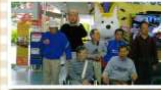
竹生寮軽作業科男子班日帰り旅行(秋田ふるさと村) 10月24日