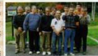
園芸班合同小旅行(蔵王) 10月10~11日