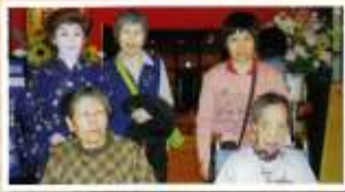
柳田新生寮・女子合同小旅行 こまち健康ランド 10月29日