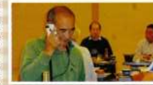
環境班・林産班合同 小旅行(浅虫) 10月16~17日