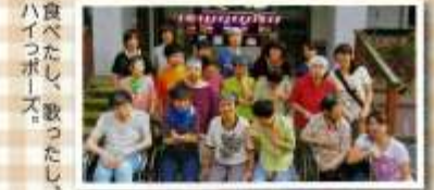
竹生寮軽作業科女子 日帰り旅行(角館) 9月11日