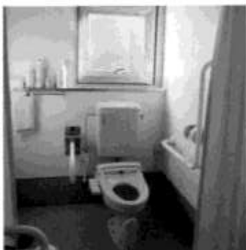
新しい東棟女子トイレです。ピカピカで使いやすいです。

師走、何かと気ぜわしい頃となりましたが、皆様におかれましてはご健勝のことと存じます。日頃より、当家族会の運営に對しまして、ご理解・ご協力を賜り厚く感謝申し上げます。さて、竹生寮家族会助成協力基金による事業の棟男子・女子および西棟女子便所改修工事も順調に進み、工事前から施設長、職員間の打ち合わせをしながら利用者に不便をかけない様に配慮いただいている所です。協力事業については利用者が安心して生活出来る様にまた、施設として安全に家族同様ぬくもりを持って暮らして行く手助けをするためのものです。竹生寮も、社会福祉法人