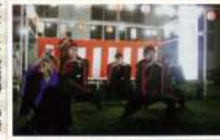
よさこせ歌舞隊「のびさんパワー全開」