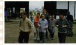
農産班合同小旅行(中尊寺) 10月22日~23日